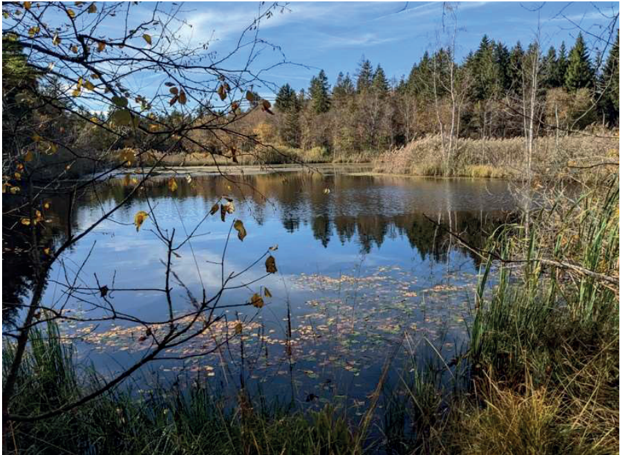
Étang des Bugnons