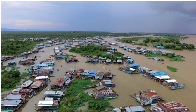
VILLAGE FLOTTANT CAMBODGE

MERCREDI 6 NOVEMBRE 2024 A 14 H RESTAURANT LES COLOMBETTES VUADENS